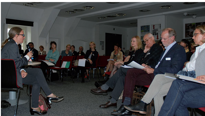
Lebhafte Diskussion am 22. September in Potsdam.

Mehr als vier Stunden Diskussion unter den Augen gekrönter Häupter Brandenburgs – zu einem Thema, das diesen Herren sicher sehr abwegig vorgekommen wäre: Im Konferenzsaal des Hauses der brandenburgisch-preußischen Geschichte tauschten sich am 22. September die Teilnehmer/innen der Fachtagung zu geschlechtergerechter Gesundheitsversorgung im Land Brandenburg aus. So vielfältig wie die Arbeitsbereiche, aus denen die Frauen und Männer kamen, so vielfältig auch die Aspekte, die sie mit Blick auf das gemeinsame Thema anrissen. Die große Überschrift: Können wir mit einem Regionalem Netzwerk eine besse-